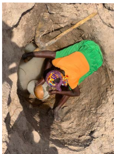
So sieht die Versorgung mit „Trinkwasser“ aktuell aus

Schon seit einigen Jahren unterstützen wir den HibeKi e.V. bei seinem Schulprojekt in Nayorku/Ghana. Dort hat im Dezember die erste Abschlussklasse die Schule erfolgreich absolviert. Nun startet ein neues Wasserprojekt, in dem die Schule, aber auch das gesamte Dorf Nayorku Zugang zu sauberem Trinkwasser erhält. Auch mit unserer Hilfe sind bereits fast 90% der dazu erforderlichen